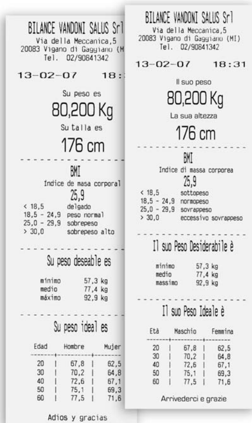
Scontrino dettagliato Ticket detallado